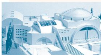
* De bouw van het bedehuis voor de gemeente van ds. Maos is meer dan alleen een kerksaal.

In de achterliggende jaren nam het verzet tegen de 'nieuwe Joodse christenen' en tegen allerlei zendingsactiviteiten van buitenaf in orthodox-religieuze kringen toe. Strikt-religieuze riepen de organisatie Yad LeAchim in het leven. Een organisatie die, zoals de naam aangeeft, beoogt een 'helpende hand' te bieden aan 'broeders' (Joden) die dreigen over te gaan tot het christelijk geloof. Nodeloos te vertellen dat deze beweging zich met man en macht ging verzetten tegen de bouw van een 'kerk voor Joden'. Van deze gemeente en van dit gebouw gaan immers een sterke evangeliserende werking uit. Mensen vragen zich af wat voor gebouw dit is, en zouden eens binnen een kijkje kunnen nemen... Yad LeAchim nam één van Israëls