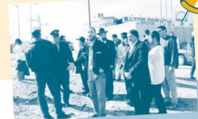
*Demonstranten proberen de bouw van de kerk te verstoren.

Net als in Nederland heeft iedere plaatselijke gemeente een bestemmingsplan. Er is voor een Jood echter geen enkele mogelijkheid een stuk grond te kopen om er een kerk op te bouwen. Een Israëliëisch bestemmingsplan is tegelijk een Joods bestemmingsplan en Joden bouwen geen kerken. Bij het plaatsje Gadera kon echter toch grond worden aangekocht, waarop 'kantoren en verenigingsgebouwen' gebouwd mogen worden. Op deze grond werd vervolgens een 'huis van samsnkomsf' geprojecteerd. De bouwplannen voorzien in een multifunctioneel centrum, waarbij naast de ruimte voor de wekelijkse erediens, ook plaats is voor een kleine uitgeverij en een school. Er werd zelfs een bescheiden zwembadje voor de kinderen ontworpen, om te voorkomen dat de bouw het predikaat 'kerk' of 'kerkelijk centrum' zou krijgen. En een kerk kan niet gebouwd worden, omdat het bestemmingsplan daar niet in voorziet. Immers, net als in onze beleving geldt voor een religieuze Jood dat waar een zwembad is, geen kerk