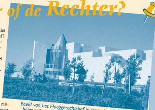
Beeld van het Hooggerechtshof in Jeruzalem; Israëls belangrijkste en meest toonaangevende rechtbank.

Israël is de Joodse staat. Dat werd vastgelegd in de onafhankelijkheidsverklaring die op 14 mei 1948 werd geproclameerd door premier David Ben-Goerion. Maar wat wil dat eigenlijk zeggen: 'Joodse staat'? Wat is eigenlijk precies 'Joods'? Iedere Jood waar ook ter wereld kan sinds 1948 naar Israël emigreren en daar volledig staatsburger worden. Maar: wie is nu eigenlijk precies een Jood? Het jodanisme is de Joodse religie. Maar vele Israëliëische staatsburgers die die religie niet praktiseren, worden toch gekwalificeerd als 'Jood'. En kan een Jood christen zijn, of boeddhist, en toch 'Jood' blijven? In Israël geldt volledige godsdienstvrijheid. Net als de meeste Westerse landen kent de Joodse staat een democratisch politiek systeem en is de rechtsstaat het fundament van de samenleving. Toch is Isra'el een wat vreemde eend in de Westerse bijt. De geschiedenis van het Joodse volk had duidelijk gemaakt dat Joden in geen enkel land ter wereld gearandeerd veilig konden leven. Vroeger of later ging het mis. Heftiger of minder ingrijpend. Coit kwam het moment in elk land waar de Joden zich vestigden dat er een reden ontstond hen te vervolgen, weg te jagen of te doden. Deze hardnekkige kwaal kreeg een eigen, huiveringwekkende naam: antisemitisme.