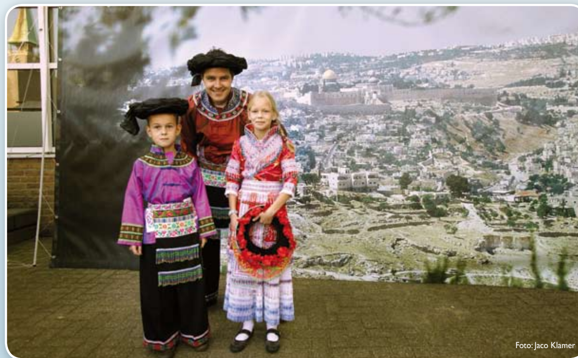
In Chinese en Malawiaanse kleding "in" Jeruzalem

Het werd een dag om in dankbaarheid op terug te zien. We hopen op een mooie opbrengst. Onze dank gaat uit naar iedereen die deze dag tot een geslaagde dag heeft gemaakt