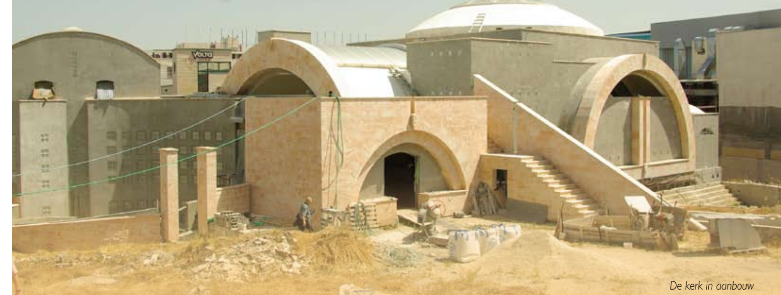
De kerk in aanbouw

In Israël wordt verder gewerkt aan de bouwplannen voor de kerk. Er is een voorlopige kostenraming gemaakt, die in de komende weken nader uitgewerkt wordt. De principe-afpraak is gemaakt dat de kosten voor de afbouw voor 50 % door het bouwfonds in Israël en voor 50 % door het Da Costa Fonds, opgebracht zullen worden. Wij verwachten in de komende weken uitsluitel te krijgen over de definitieve afbouwsom. Dan willen we u graag informeren. Op dit moment werken wij ook aan een plan om de benodigde fondsen te werven via onze achterban, met name