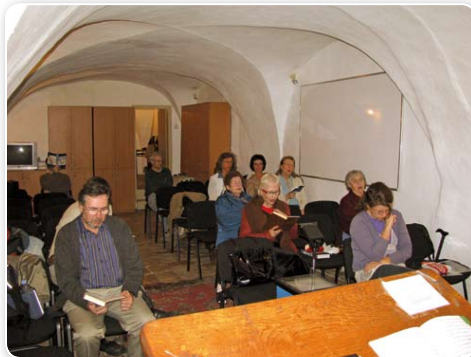
samenkomst van een gemeente in Jeruzalem

Op dit moment telt Israël 7.424.400 inwoners (peiling 2008). Daarvan zijn 5.650.500 personen Joods, 1.513.200 personen behoren bij de Arabische minderheid (waarvan 1.142.000 personen moslim zijn en 120.000 christen). Het aantal Messiasbelijdende Joden wordt geschat