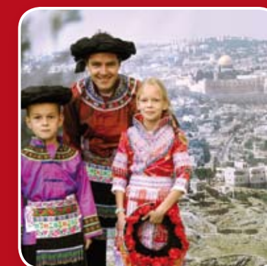
10-jarig bestaan gevierd