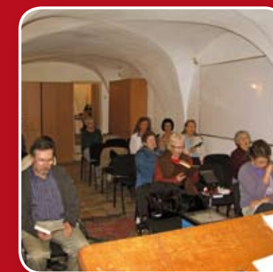
Jonge kerk in Israël