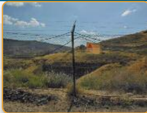
De gevaarlijke Golan-hoogvlakte.