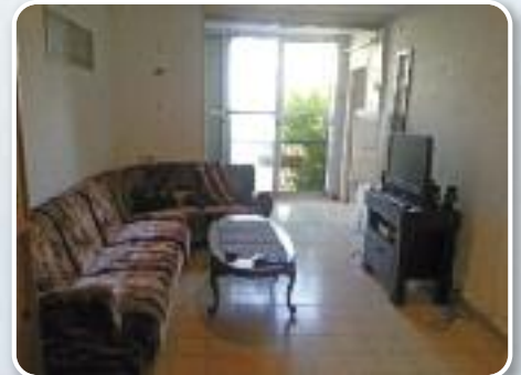
Het appartement in Tel Aviv, geschikt voor ontmoeting met medestudenten en voor Bijbelstudie.