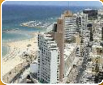
Blik op Tel Aviv, waar een nieuw project van start gaat (zie pagina 2).