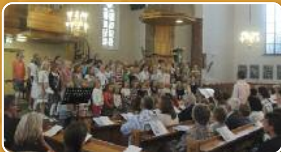
Samengesteld Jeugdkoor zingt tijdens het presentatieconcert.

Op 31 augustus werd in de Hervormde Kerk te Yerseke een presentatieconcert gehouden. De collecte tijdens deze bijeenkomst had de mooie opbrengst van € 806,25.