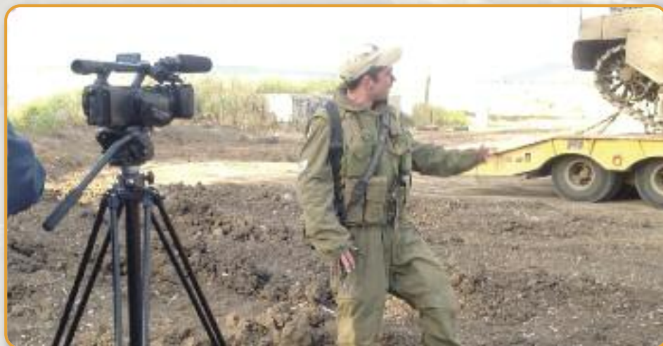
Tankcommandant op de Golan Hoogte geeft uitleg voor de camera van het Isaac Da Costa Fonds. Het filmpje staat op de website ( dacostafonds.nl ).

'Maar waarom zou uw land dat dan doen?' is de vraag van een journalist. Zegt zo'n vertegenwoordiger van de regering in Syrië: 'Omdat Israël hier de vertegenwoordiger van Amerika en het Westen is.'