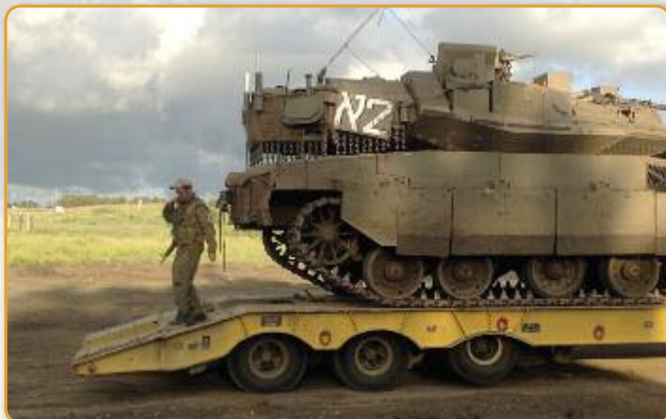
De Merkava (= Strijdwagen) is een enorm gevaarte. De bemanning wordt optimaal beschermd en heeft binnenin veel ruimte. Nadeel daarvan is het grote gewicht en de lage snelheid van de tank.