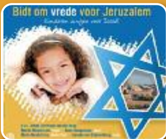
Nieuwe Isaac Da Costa CD (zie pagina 6)