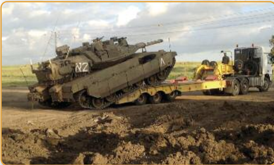
Op de trailer lijkt de kolos een log gevaarte - totdat de bulderende dieselmotor er opeens een wendbare terreinauto van maakt...

invloed meer ondergaan van het Westen en zouden de Arabische landen in staat zijn zelf al hun problemen op te lossen. Bovendien dicteert de islam: land dat eens islamitisch land is geweest, kan nooit meer niet-islamitisch land worden. 'Het Westen' is de groep landen die lang koloniale macht hadden. Hun laatste project was een staat voor Joden creëren als genoegdoening voor de Holocaust en tegelijk om de Arabische wereld te blijven controleren. Toen een coalitie van landen onder leiding van de Amerikanen Irak aanvielen in 1991 om dat land te dwingen het Emiraat Koeweit te verlaten, vuurde het regime van dictator Saddam Hoessein om deze zelfde reden 39 Scud-raketten op Israël af. Het is de leugen die regeert. Want het Joodse volk is niet uitheems, maar hoort bij Jeruzalem, bij Judea, bij Galilea, bij al die Bijbelse plaatsen. Joden in het land Israël zijn niet de vertegenwoordigers van een koloniale macht, maar ze zijn thuis. Jaarlijks tijdens het Pesachfeest spreekt het Joodse volk overal ter wereld de wens uit om ooit terug te mogen keren naar het oude vaderland. Ieder jaar, 1878 jaar lang, sinds de Tempel in 70 na Christus werd verwoest door de Romeinen eindigt de Pesach maaltijd met de uitspraak: 'Volgend jaar in Jeruzalem!'