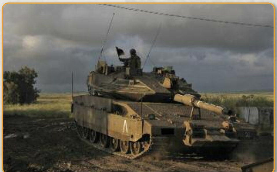
De ontmoeting is voorbij, de commandant zwaait vanaf de koepel en de tank verdwijnt brullend in de avond. Zonder twijfel vormt deze tank onderdeel van de parate legermacht bij een eventuele aanval uit Syrië...