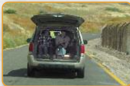
Webmasters aan het werk...

In april waren verschillende vertegenwoordigers van het Isaac Da Costa Fonds in Israël vanwege de afronding van ons grootste project: de bouw van het huis van samenkomen van de Messias-belijdende gemeente van Gedera. Tijdens een rit over de Golan Hoogvlakte, stuitte we op een tankcommandant met zijn bemanning. Ze waren bezig een tank af te laden van een trailer. Allervriendelijkst stond hij ons even te woord. Hij legde uit dat ze terugkeerden van een oefening en dat 'zijn' Merkava IV de 'beste tank ter wereld was'. Met brullende motor verdween het gevaarte even later in de avond. Ik vraag me af waar deze commandant nu is. Ook paraat? Stond zijn tank ook in de rij op de voorkant van de krant op 28 augustus?