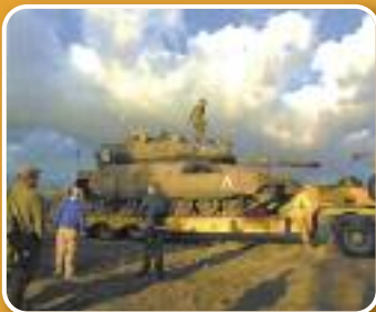
Onverwachte ontmoeting. (zie pagina 4 en 5)