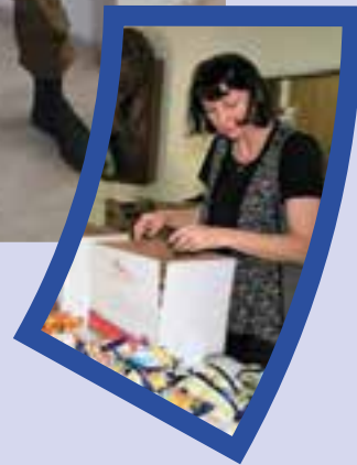
Inpakken van zorgpakketten voor de soldaten