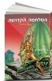
De Heilige Oorlog van Bunyan