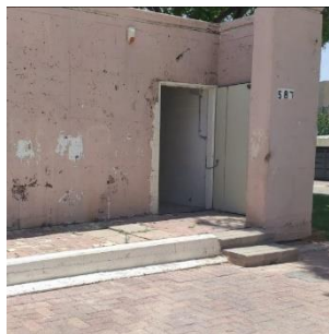
Het kantoor in Berseba bevindt zich in een openbare schuilkelder