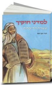
Kinderbijbel van Van Dam