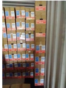
Goederen voor Nechama in Nof HaGalil (Nazareth)