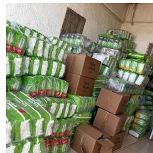
Luiers die een organisatie zo genereus heeft gedoneerd voor onze behoeftige moeders in het zuiden