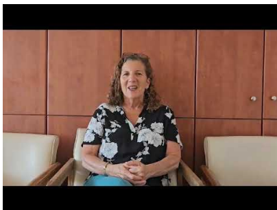
Klik op de afbeelding voor een video met een update door Sandy (Eng.)

Ik vroeg Oxana waar ze haar kracht vandaan haalt om anderen te blijven helpen - ze huilt, ze bidt en ze vindt nieuwe kracht in de Heere. Ze deelde Psalm 130:7 “Israël hope op de HEERE; want bij de HEERE is goedertierenheid, en bij Hem is veel verlossing”. Ze vraagt jullie om te bidden voor bescherming voor haar kinderen die in het leger dienen.”