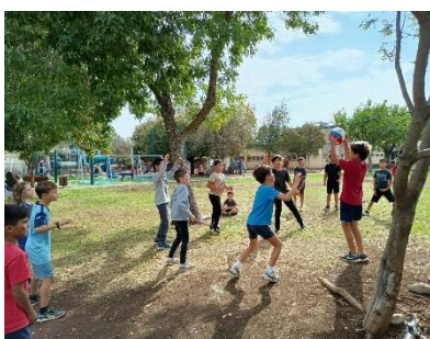
Sportevenementen voor de tieners

De lokale overheden en scholen zijn betrokken bij de uitvoering van alle programma's, evenals vrijwilligers uit het dorp zelf.