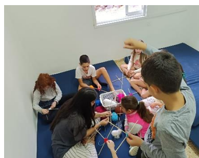
Knutselen voor de kinderen