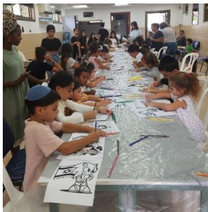
Kleurplaten voor kinderen

We steunen deze uitgeverij bij het gratis uitdelen van boeken en kleurplaten. In veel gezinnen is een van de echtgenoten opgeroepen en is het een uitdaging om de kinderen thuis bezig te houden. HaGefen heeft al duizenden kleurplaten gedrukt en uitgedeeld aan kinderen in schuilkelders, maar ook veel boeken uitgedeeld - in één geval zo'n 120 kinderboeken voor één gemeente die daarom vroeg.