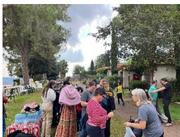
De geëvacueerde gemeente uit Sderot helpen