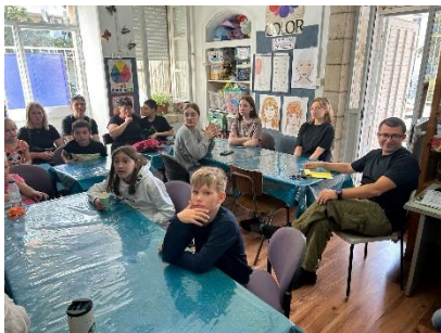
Opvang kinderen die geëvacueerd zijn.