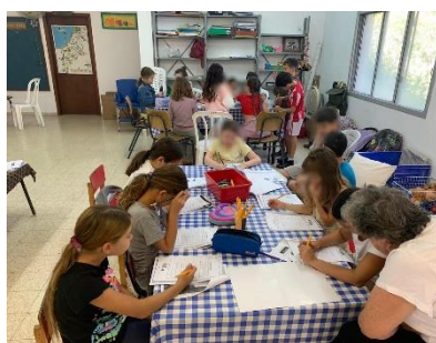
Kleuren voor de kinderen