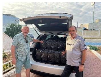
Voorraden brengen naar Holocaust-overlevenden en andere behoeftigen in deze tijd van oorlog