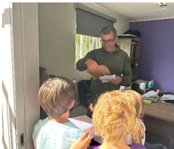
Even terug op school.